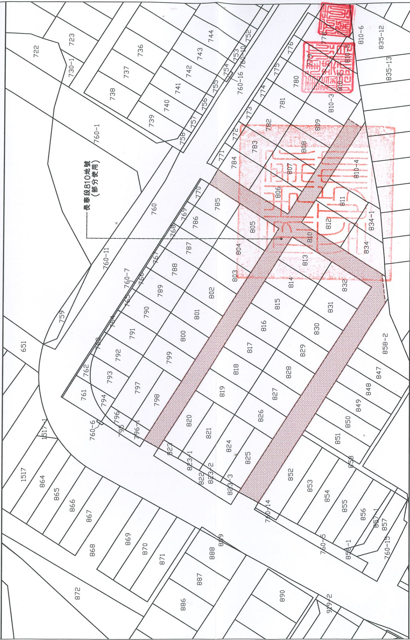
認定現有巷道用地籍圖 S:1/500