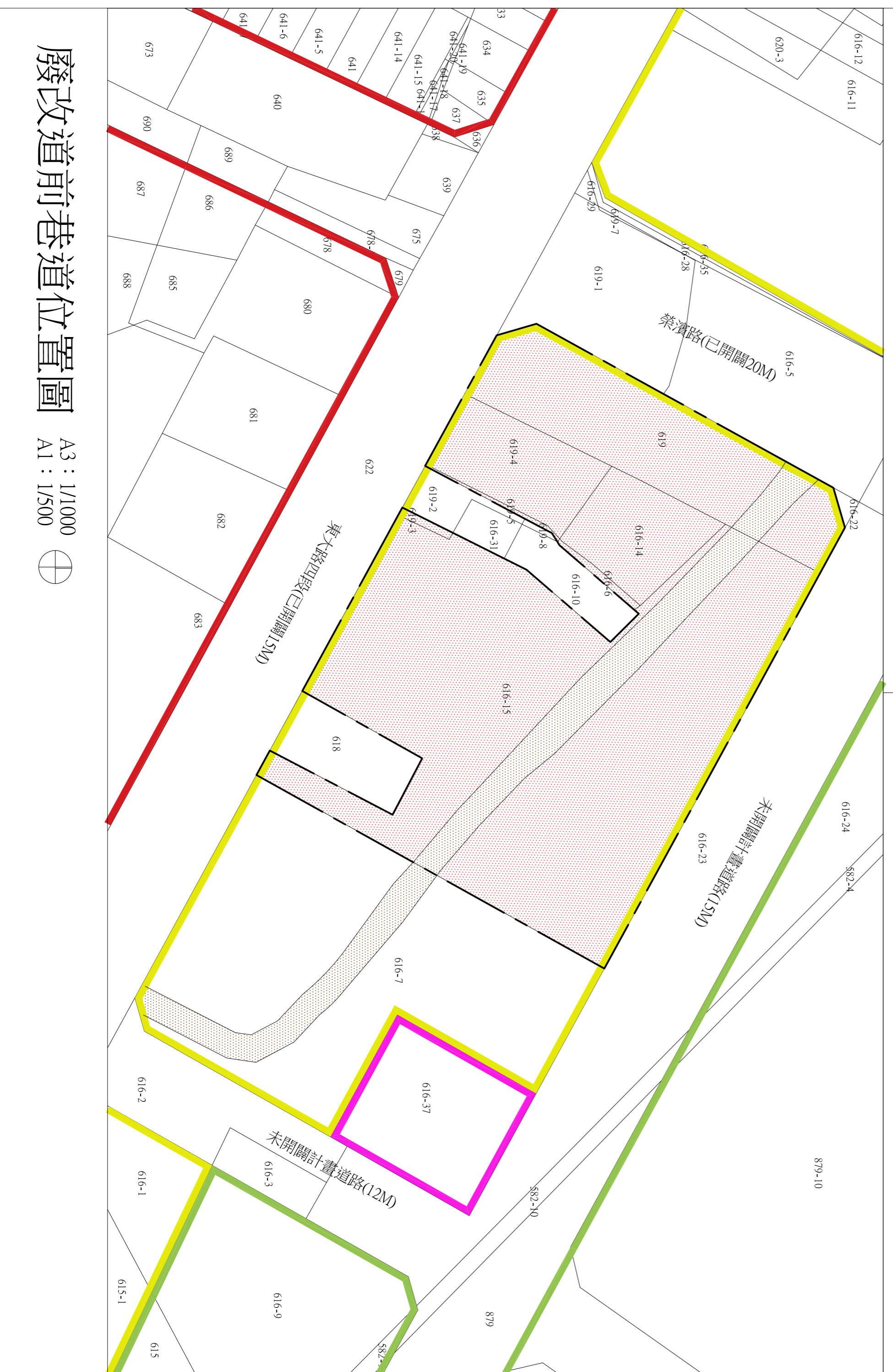
廢改道前巷道位置圖 A3：1/1000 A1：1/500