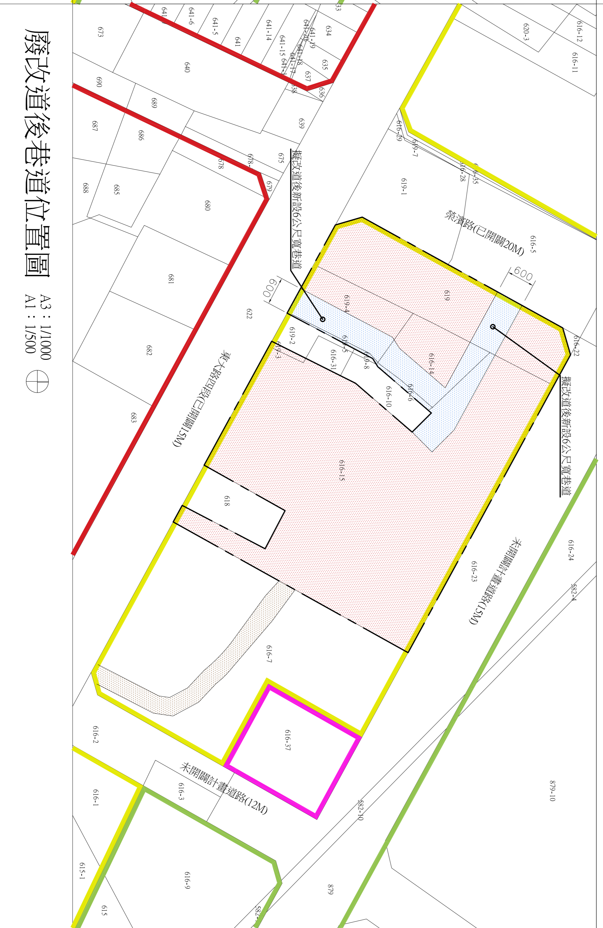
廢改道後巷道位置圖 A3：1/1000 A1：1/500