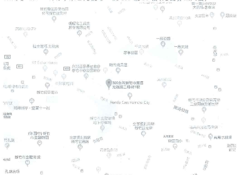
開會地點位置示意圖