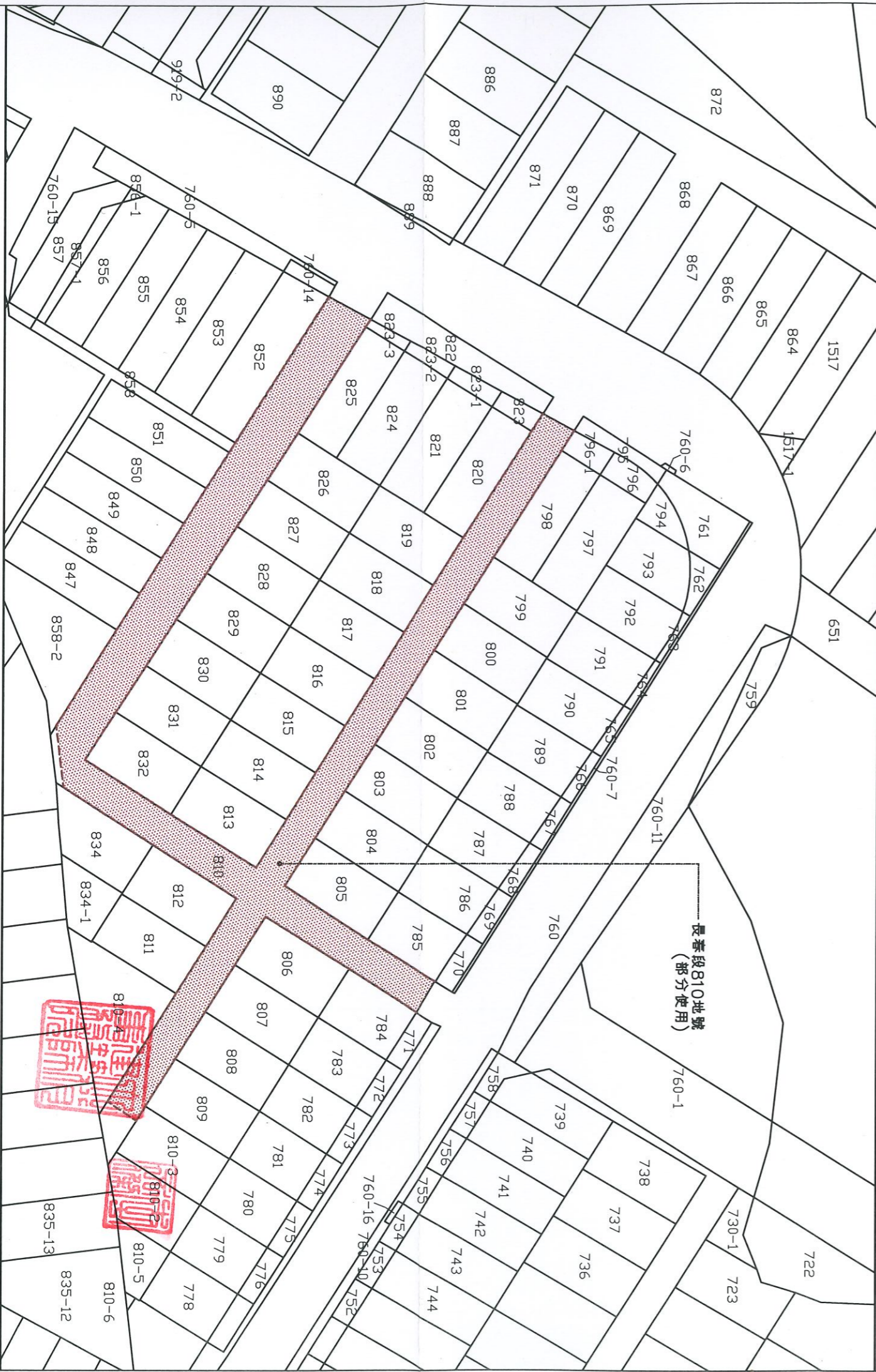
擬認定現有巷道用地地籍圖 S:1/500